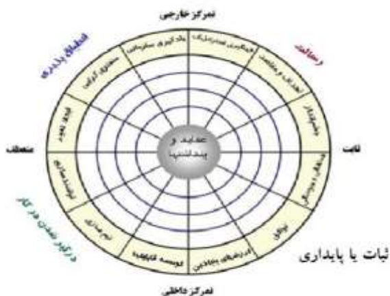
شکل ۱: مدل فرهنگ سازمانی دنیسون